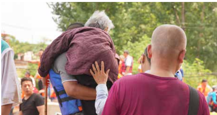
寺庄顶村救援现场