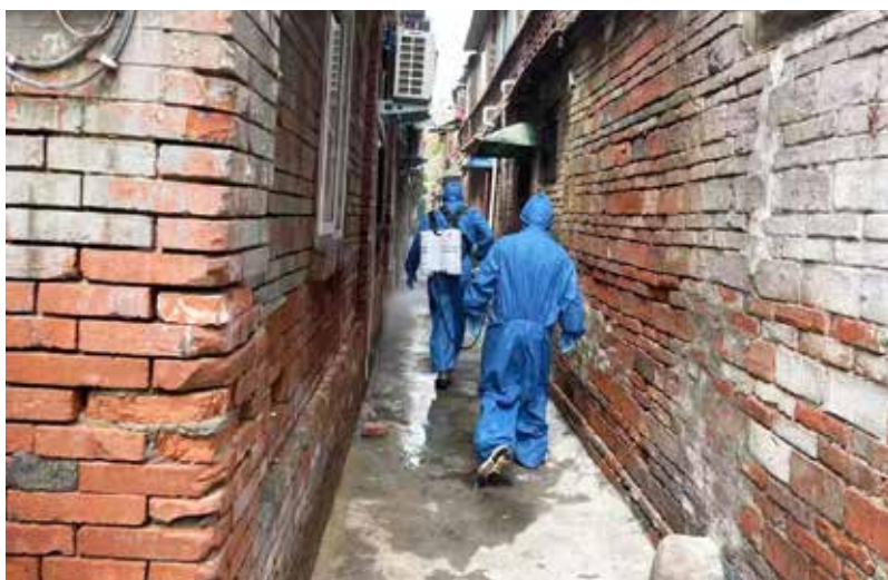
“红十字消杀志愿服务队”深入郑州、新乡、鹤壁等地重点场所开展防疫消杀