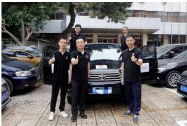
7月21日，中国红基会救灾工作组从北京出发赶赴河南投入救灾

河南强降雨发生后，中国红基会前方救灾工作组迅速赶赴河南郑州、新乡等地，持续奋战半个月，不断回传当地灾情，将社会爱心与当地最紧迫的需求高效衔接。“中国红十字基金会驰援河南救援队”争分夺秒，紧急转移救援受灾群众。