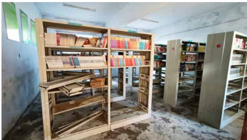
卫辉市上乐村镇第三中学学校图书室书架下三层书籍均在洪涝灾害中损毁