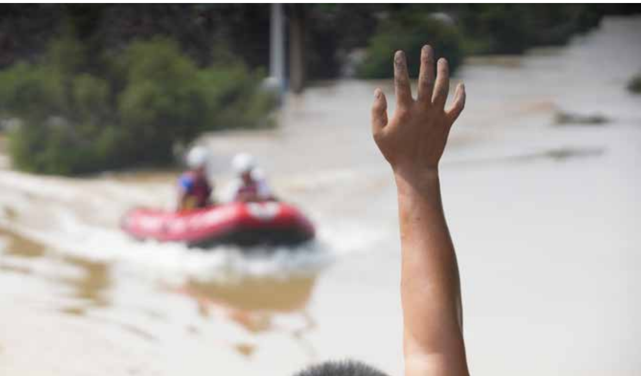
受困群众远远地向救援队招手。许多人受困家中后长时间没有进食，迫切渴望获救