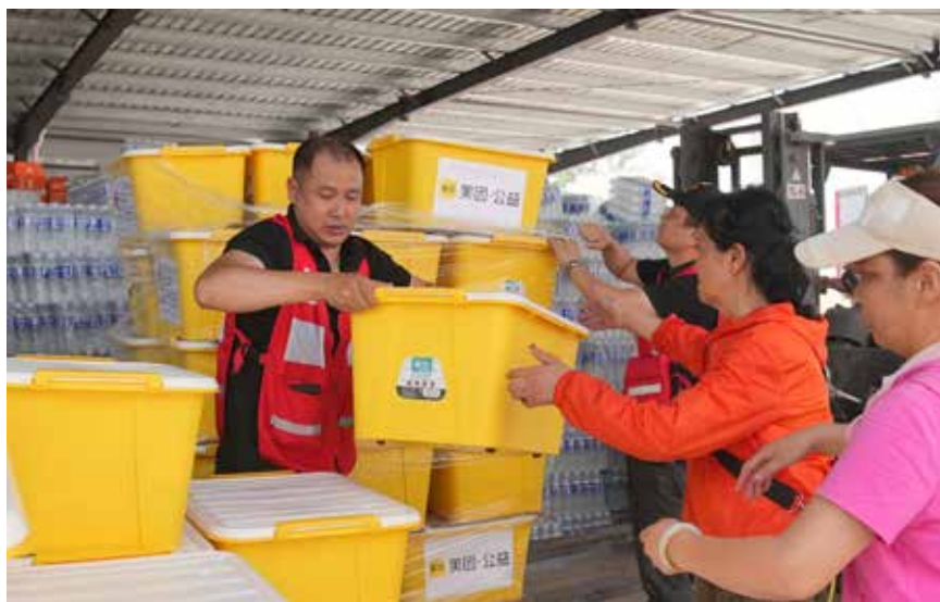
赈济家庭箱在安置点发放