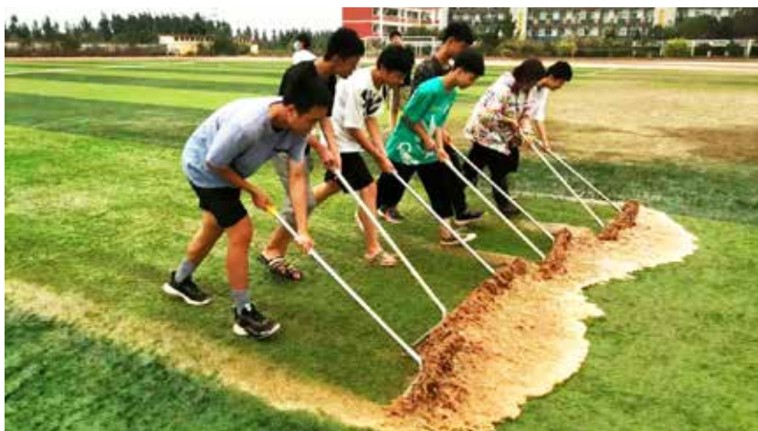
新乡市凤泉区第39中学500名师生家长连续十日奋战开展清淤、操场维护工作