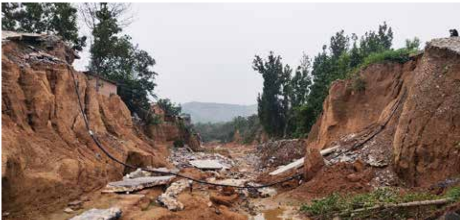
新乡凤泉区分将池村水库大坝因受灾完全损毁，联通村外的主要道路交通中断