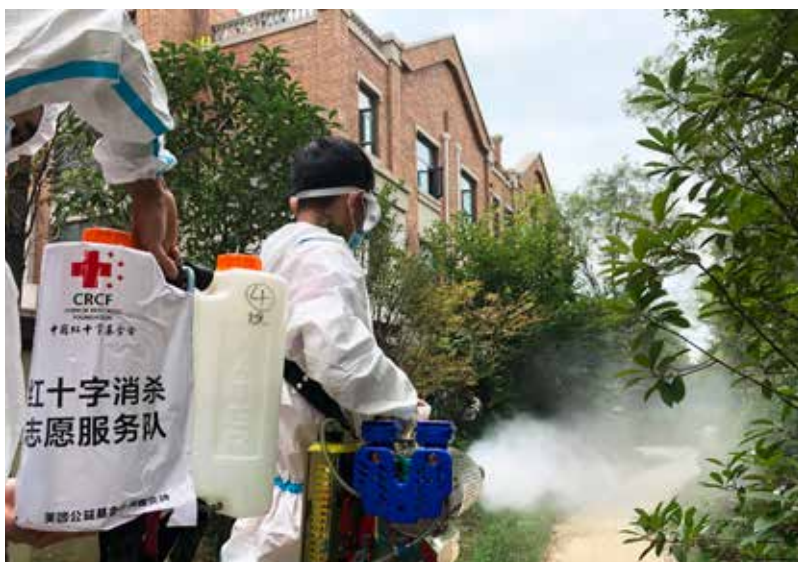
“红十字消杀志愿服务队”深入郑州、新乡、鹤壁等地重点场所开展防疫消杀