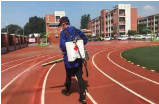
红十字消杀志愿服务队在耿黄庄中心小学进行消杀