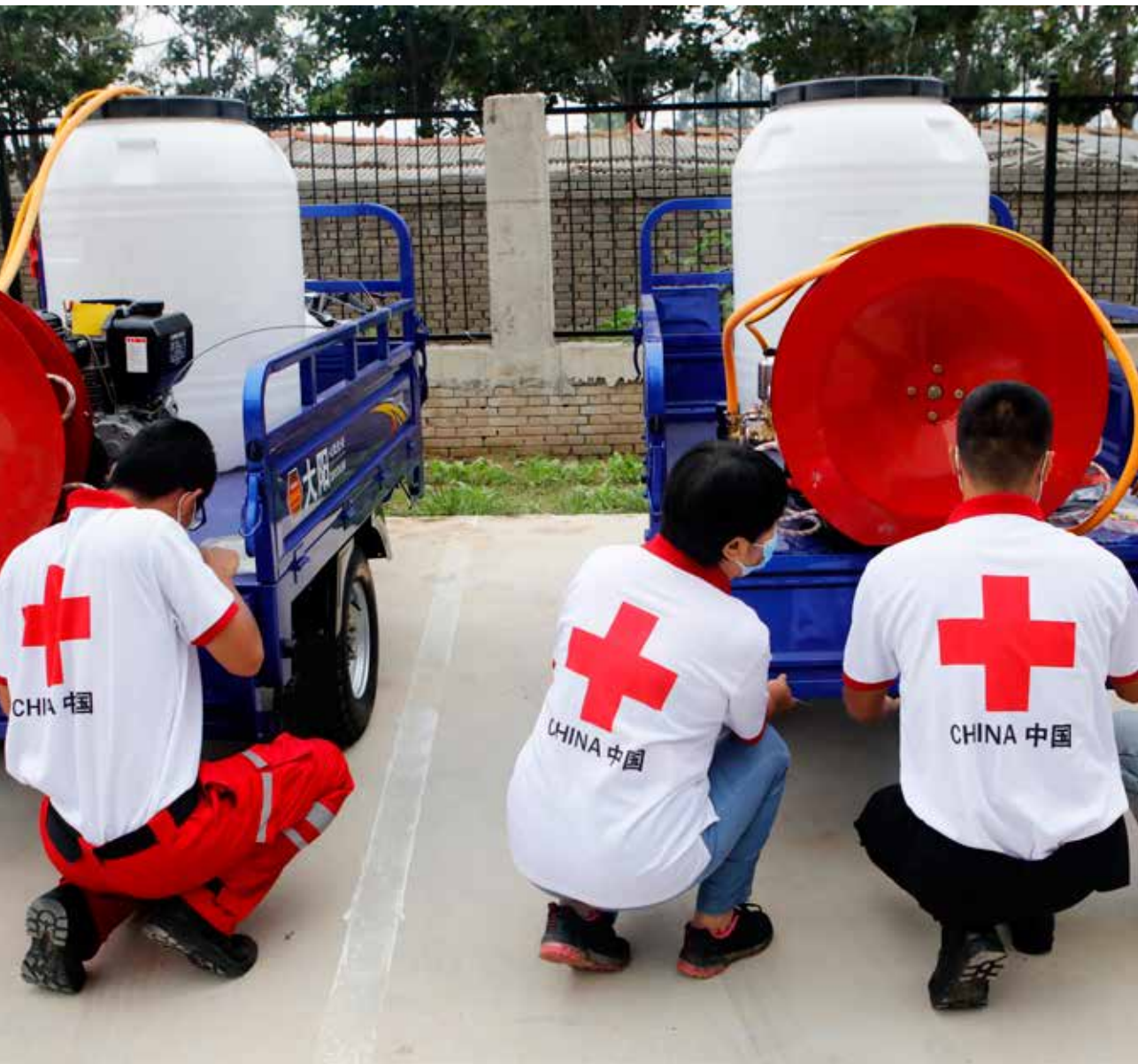
“红十字消杀志愿服务队”深入郑州、新乡、鹤壁等地重点场所开展防疫消杀