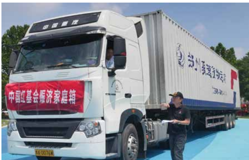
中国红十字基金会紧急调配赈济家庭箱