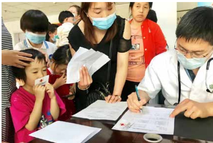
医生详细问询孩子的病情