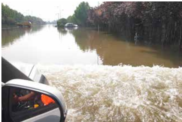
工作组乘车在积水中行进