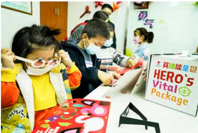
患儿积极参与“心情眼镜”主题艺术探访活动

后仅3个工作日即完成拨付，2064名白血病儿童、1790名先天性心脏病儿童收到期盼已久的资助款。