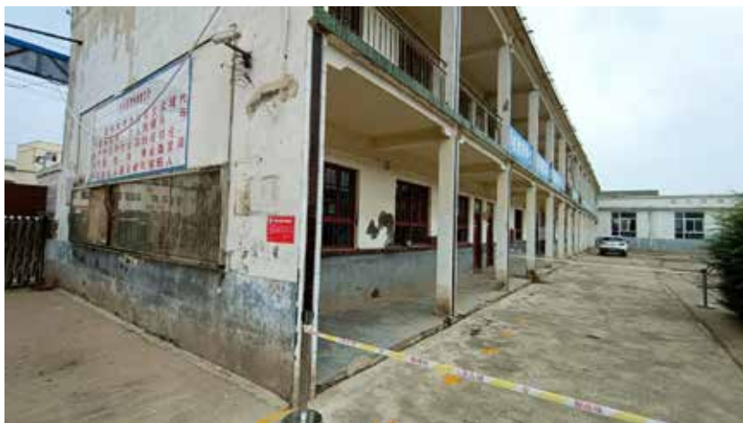
鹤壁市浚县新镇镇新镇中心小学全校建筑为D级危房，只能做拆除处理，杜绝使用