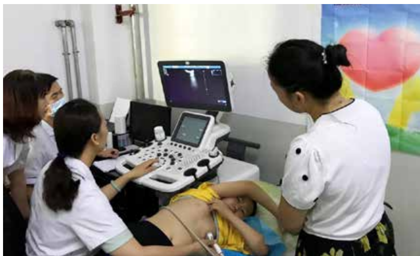
安贞医院的医生在为前来筛查的孩子做检查