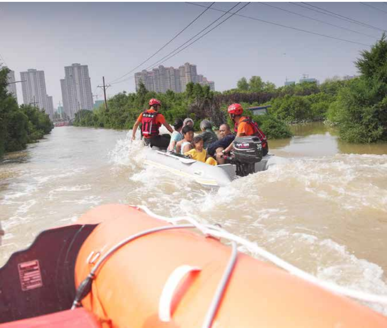
一艘冲锋舟或救生艇大约可以运送5到6名受困群众，救援队在水上穿梭往来不停