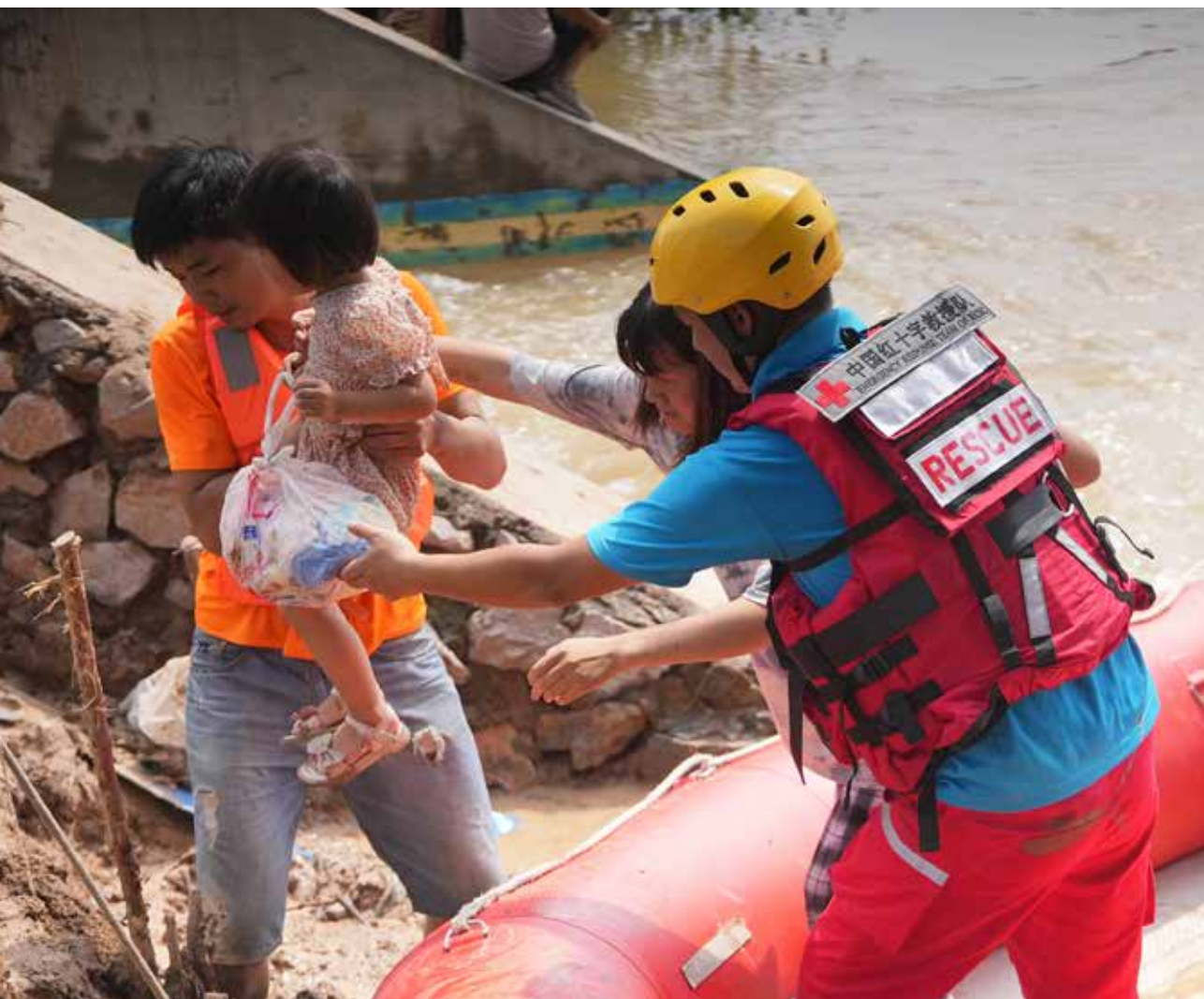
救援现场 老人、孩子、孕妇、伤者被优先送出村，救援进行有序