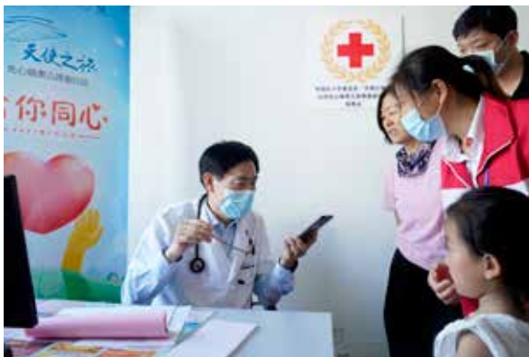
医疗专家详细了解患儿情况