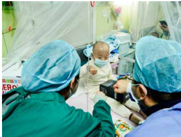
工作人员与患儿家长为白血病患儿童加油鼓气