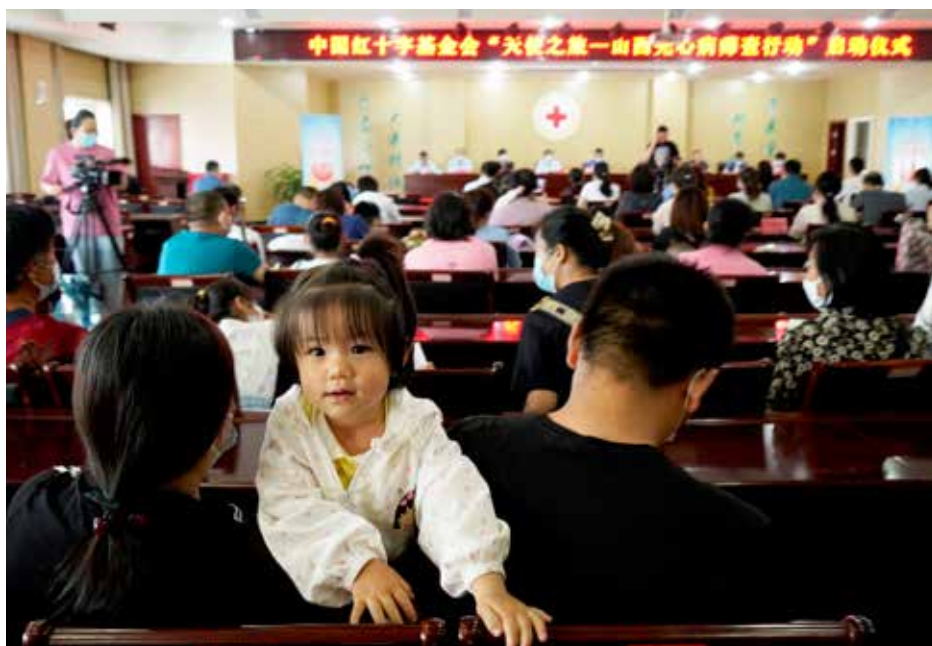
“天使之旅”山西先心病患儿筛查救助行动启动仪式