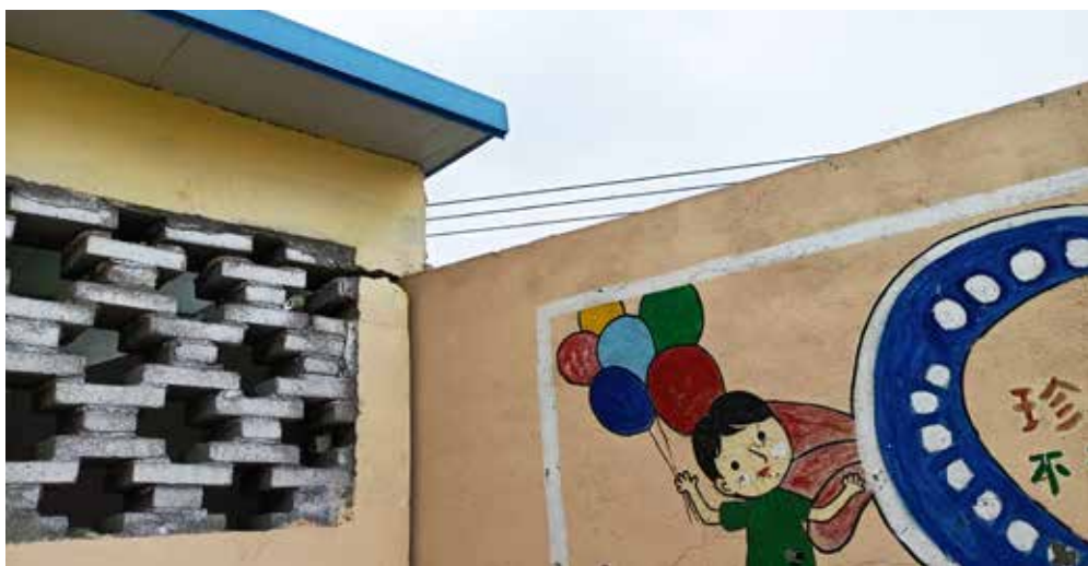
辉县市拍石头乡小学墙壁裂隙，墙外为落差山体