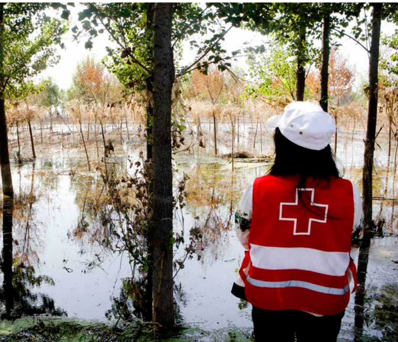
中国红基会灾后重建工作组在鹤壁浚县调研