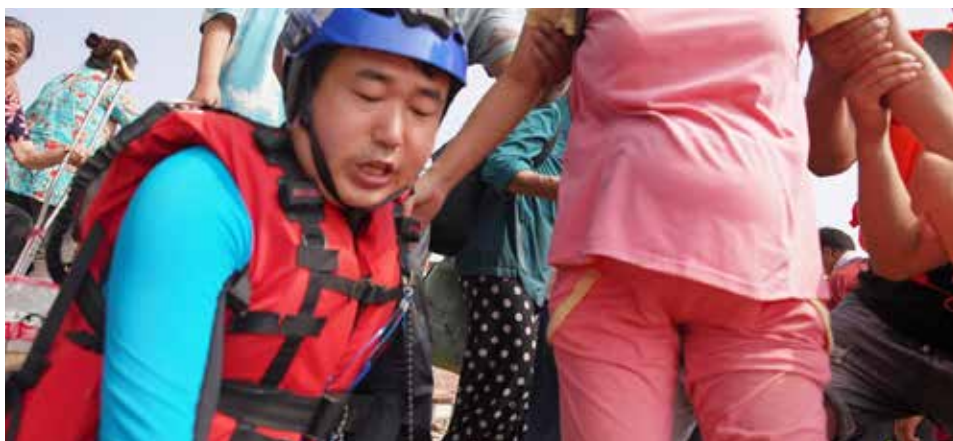
一位怀孕 39 周的孕妇首先被救出，救援队员将她小心翼翼地扶上冲锋舟。获救后，这名孕妇激动落泪