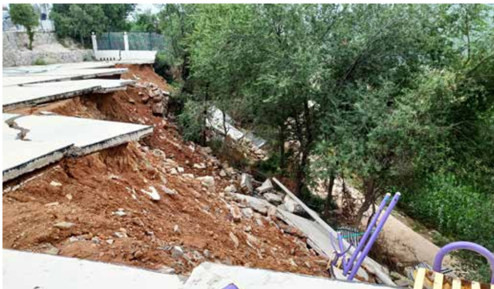
辉县市拍石头乡小学场地塌陷