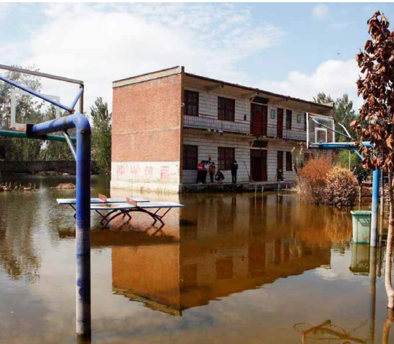
8月23日，鹤壁市浚县新镇镇淇门中心小学积水仍未退去