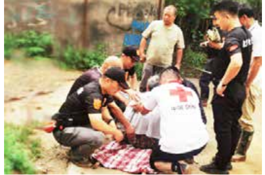
青岛红十字搜救队等用自制担架转移受困老人

妇女，乃至残疾人等。断水断电，通讯失联，缺少食物和干净的饮用水，不少体弱老人、病人还缺医少药，境况十分危险。