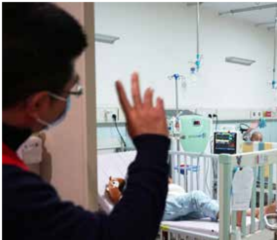
中国红基会工作人员探访已获得救助的白血病儿童