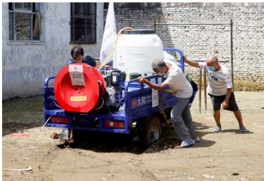
“红十字消杀志愿服务队”深入受灾地区村庄、学校等重点场所全力开展防疫消杀