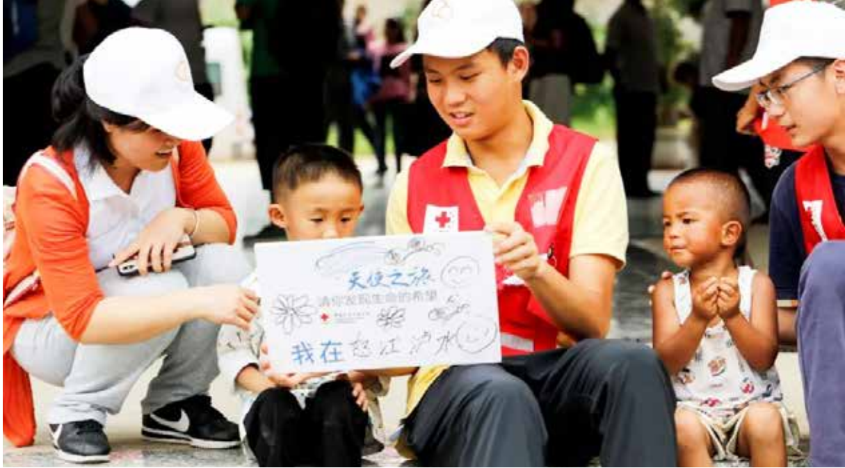
“国家彩票公益金项目” 志愿者参与先心病筛查行动

按照审计署要求进一步规范流程；根据财政部要求制定项目资助管理办法；项目管理系统启动正式运行和二期升级改造；完成项目执行手册修订；启动本年度第一批拨款前的患儿情况信息核实工作，覆盖 31 个省（自治区、直辖市）及新疆生产建设兵团的 3800 余名白血病、先心病儿童；启动本年度第一次专家评审工作，评审患儿 7337 名，其中白血病患儿 6233 名、先心病患儿 1104 名；积极动员 20 家定点医院参与本年度先心病儿童筛查行动，与 13 家达成紧急救助合作，预计全国 15 个市（区、县）的近 2000 名先心病儿童将从中受益。