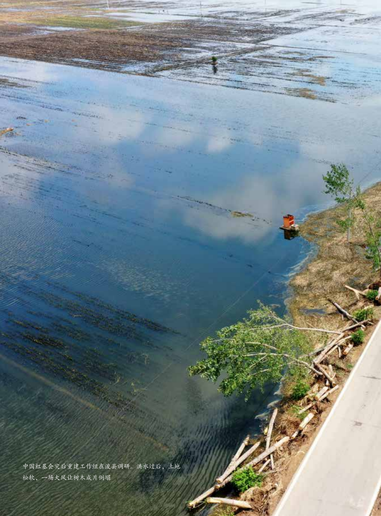
中国红基会灾后重建工作组在浚县调研。洪水过后，土地松软，一场大风让树木成片倒塌