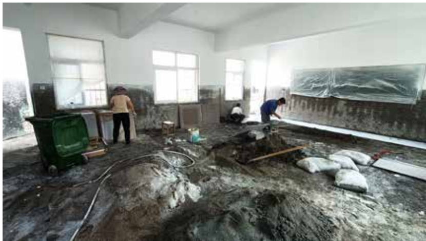
严重受损的新乡牧野区寺庄顶小学正在进行教室墙面粉刷和地面铺设