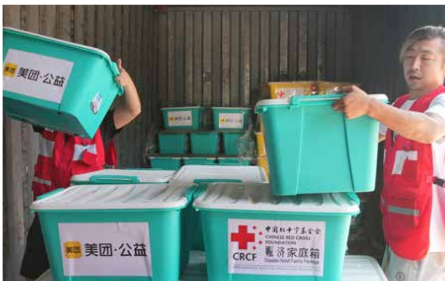
中国红基会工作人员与志愿者装卸赈济家庭箱