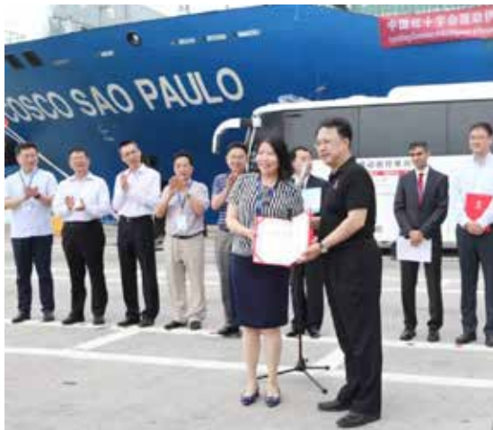
2018年9月28日，中国红十字会援助伊拉克人道救援设备在深圳蛇口码头启运

因此，对我们来说，必须研究互联网，掌握互联网发展动态，探索新媒体与公益慈善事业全面深度融合发展；要创新公益慈善思维方式，不囿于传统，勇于用互联网思维，开创公益慈善事业的新局面、新境界。此外，公益慈善组织还要进一步发展新媒体合作伙伴，建立新的传播平台，积极作为，不断创新传播手段和话语方式，为公益慈善事业的发展营造良好的舆论环境。📢