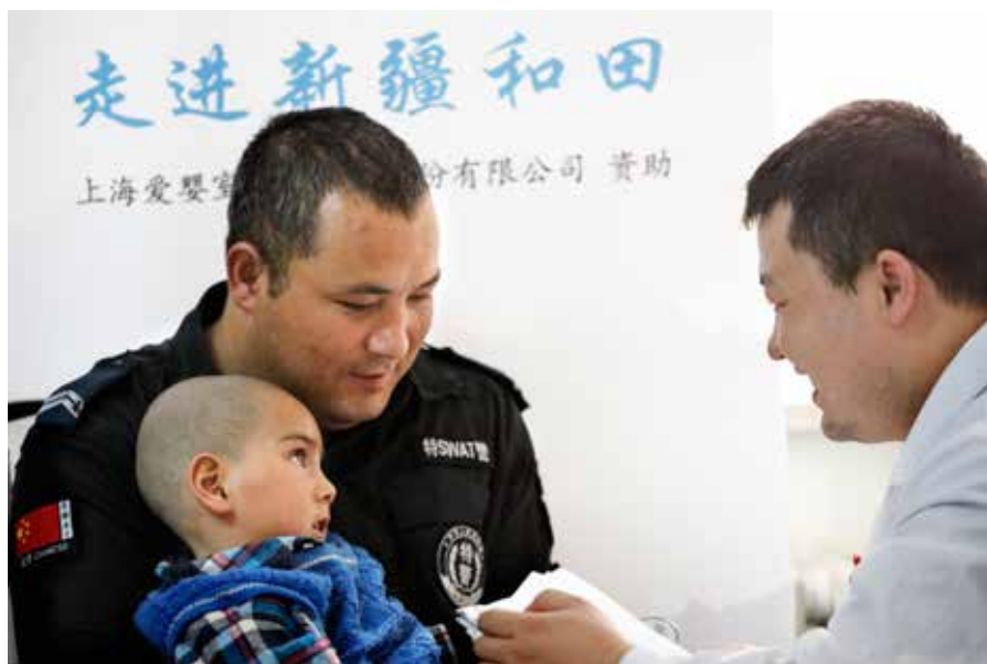
| 专家们对前来参加筛查活动的疑似先心病患儿进行检查