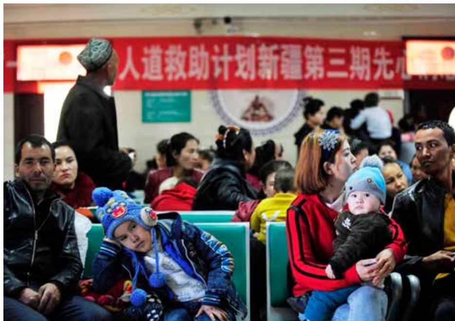
| 等待筛查中的患儿及家长