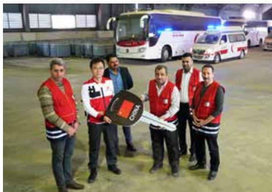
中国红十字会援助的移动医疗单元在伊拉克南部港口城市巴士拉交接