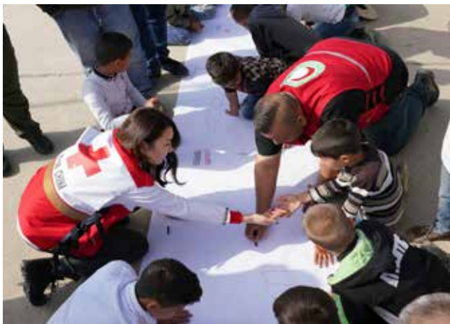
中伊红会共同为受武装冲突影响的儿童开展心理支持活动