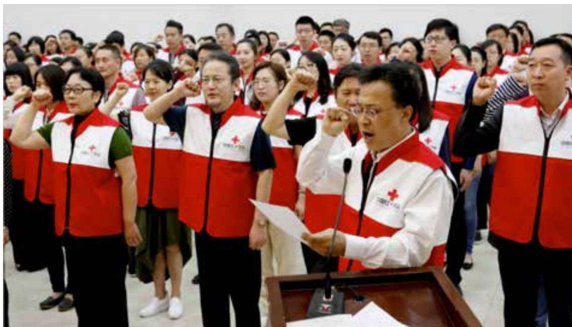
2017年5月8日，中国红十字会总会举行“我是红十字人”主题宣誓活动，郭长江带领在京红十字工作者、志愿者等庄严宣誓

信力。公信力来源于组织自身高效、规范、透明的运作，慈善法从法治层面为整个公益慈善组织行业发展提供了法律依据，使公益慈善组织有法可依、有法必依、违法必究，最终会极大提升公益慈善组织的公信力。这也有利于重塑社会对公益慈善事业的信心，有利于重拾社会对公益慈善组织的信任，吸引社会公众参与公益慈善事业。