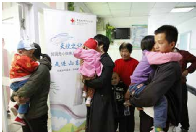
| 正在等待筛查中的孩子及家属