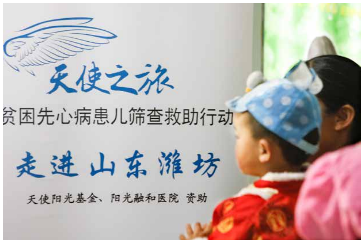
| 4月17日，“天使阳光 全心救助”——山东贫困先心病患儿筛查救助行动在山东启动