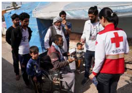
中国红十字会项目组在伊流离失所者聚居区评估人道需求

经历连年战乱，伊拉克医疗卫生、食品、饮用水等基本生活保障堪忧，境内有超过 200 万民众流离失所，超过 1000 万人需要人道援助。