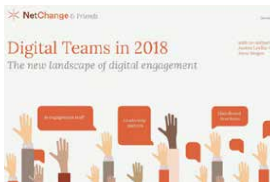
图 / NetChange「2018 数字团队：数字化参与的新格局」报告

现在已经证明，拥有数字专长的领导者，并能举办全新的活动与倡议的团队，将为组织带来更成功的数字计划。