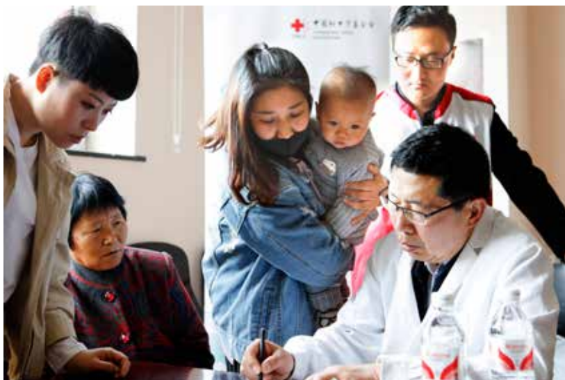
项目首站来到潍坊市昌乐县，“天使阳光基金”定点医院——阳光融和医院承担首站筛查救助的任务。图为医生专家志愿者团队在询问家长有关孩子的具体情况