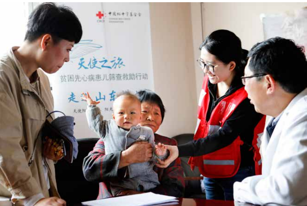
| 医生志愿者在给孩子进行检查，筛查先心病指征