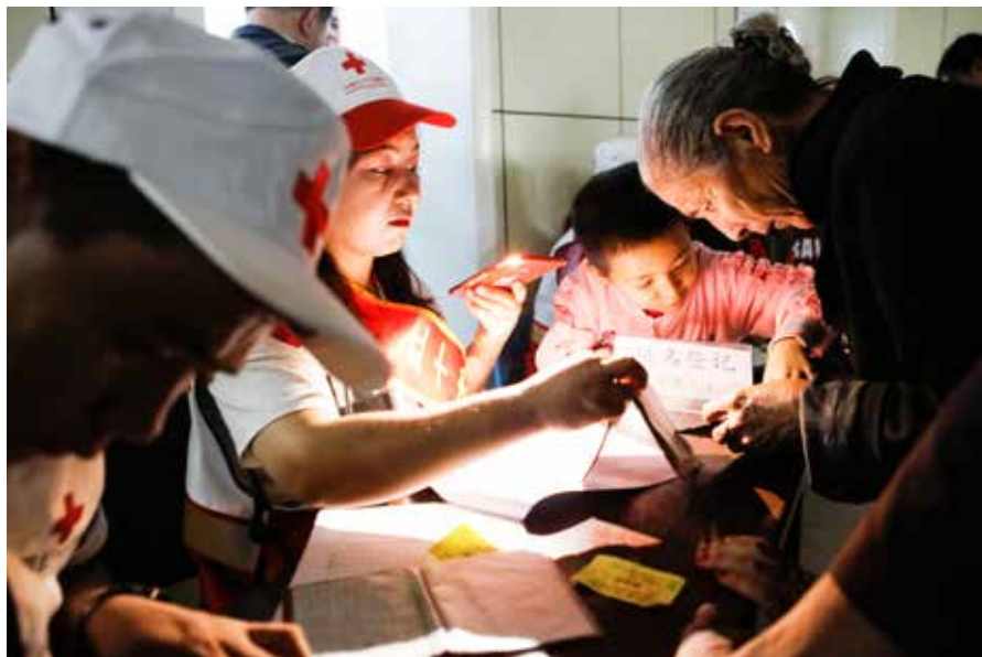
| 4月25日，中国红基会爱婴室母婴关爱基金在和田地区人民医院启动“天使之旅——新疆和田贫困先心病患儿筛查行动”