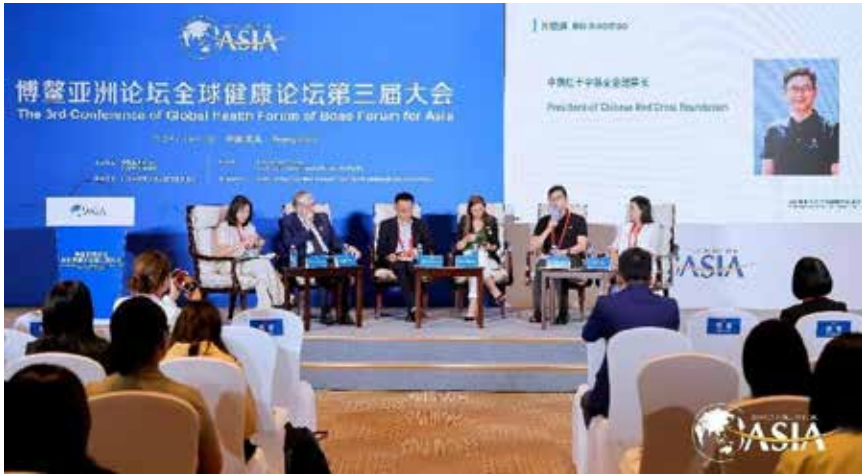
中国红十字基金会理事长贝晓超参加分论坛讨论