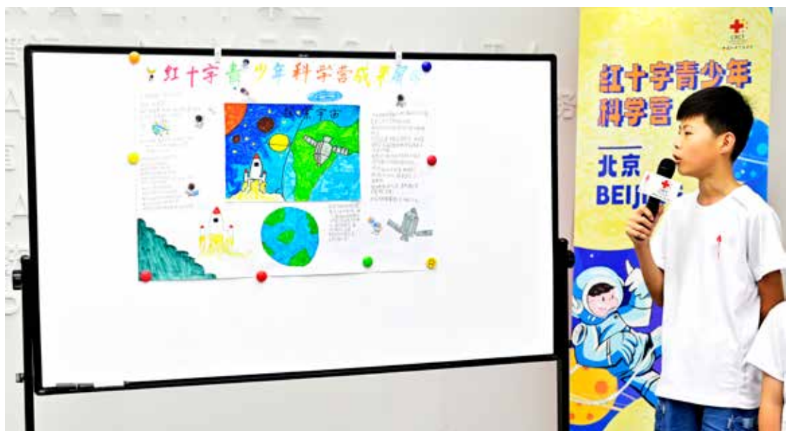
闭营仪式上，同学们以小组形式登台汇报研学成果，总结分享自己在活动中的所学所思和想象