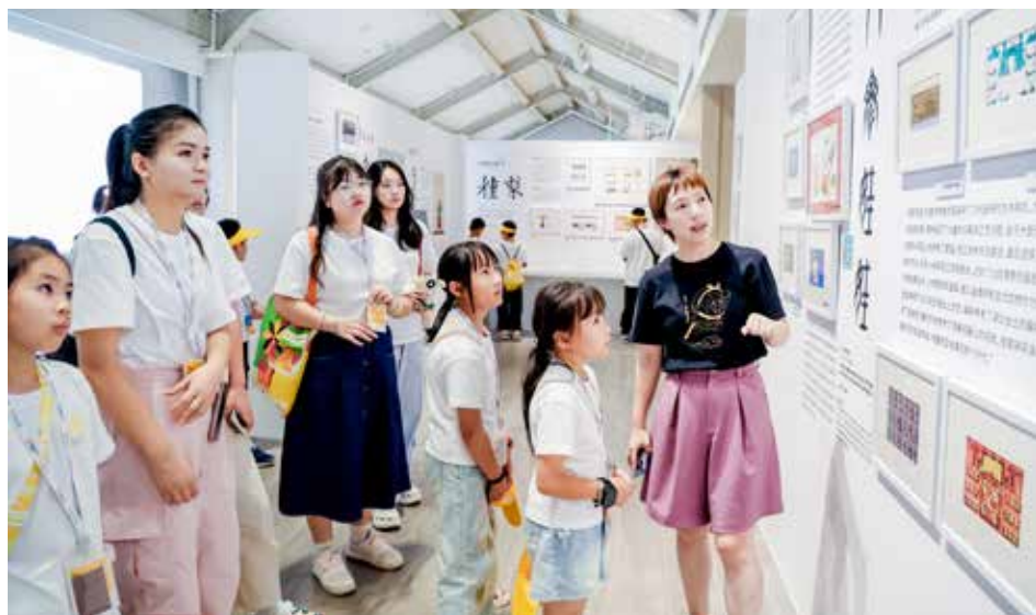
夏令营期间，同学们通过参观学习和创作，体验多种艺术形式