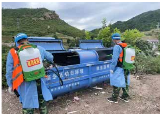
9月1日,1000台消杀喷雾器运抵辽宁省受灾严重的地区并投入使用

该批消杀喷雾器使用静电喷雾专利技术,使消杀药水经由喷雾器产生的颗粒吸附到物体表面上,实现均匀覆盖,从而使消杀工作达到最大覆盖率。🇨🇳