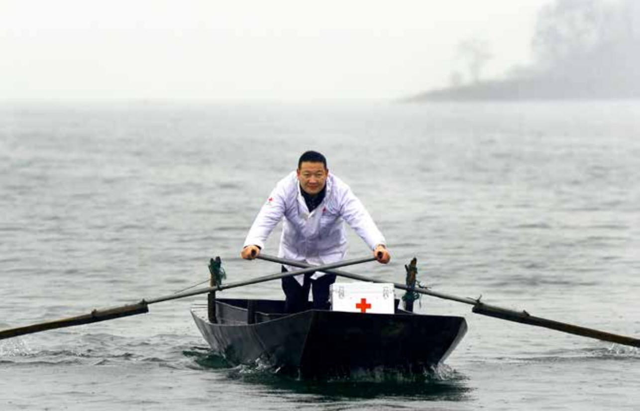
余家军划着小船为留守在岛上的老人出诊