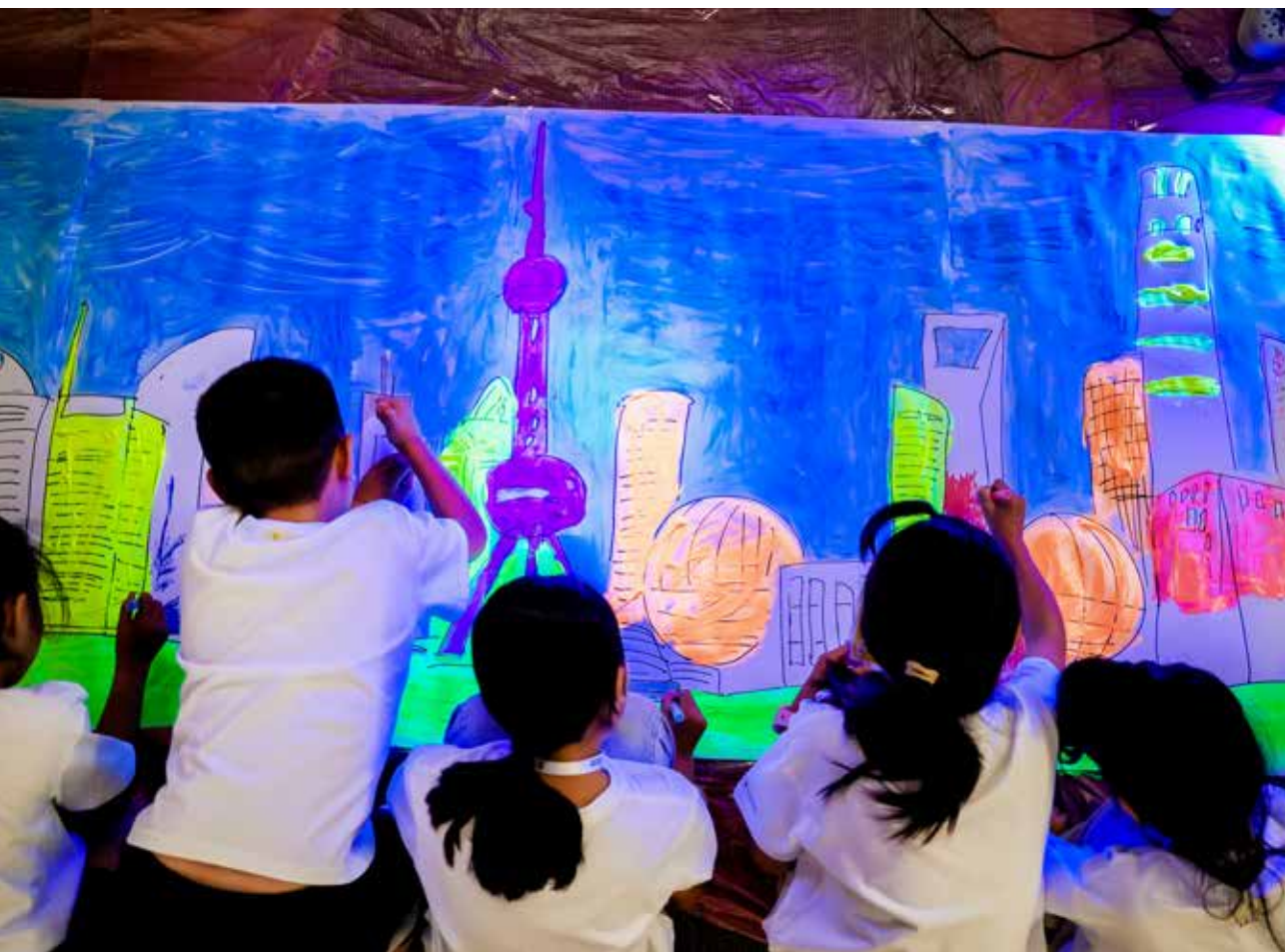
夏令营期间，同学们通过参观学习和创作，体验多种艺术形式