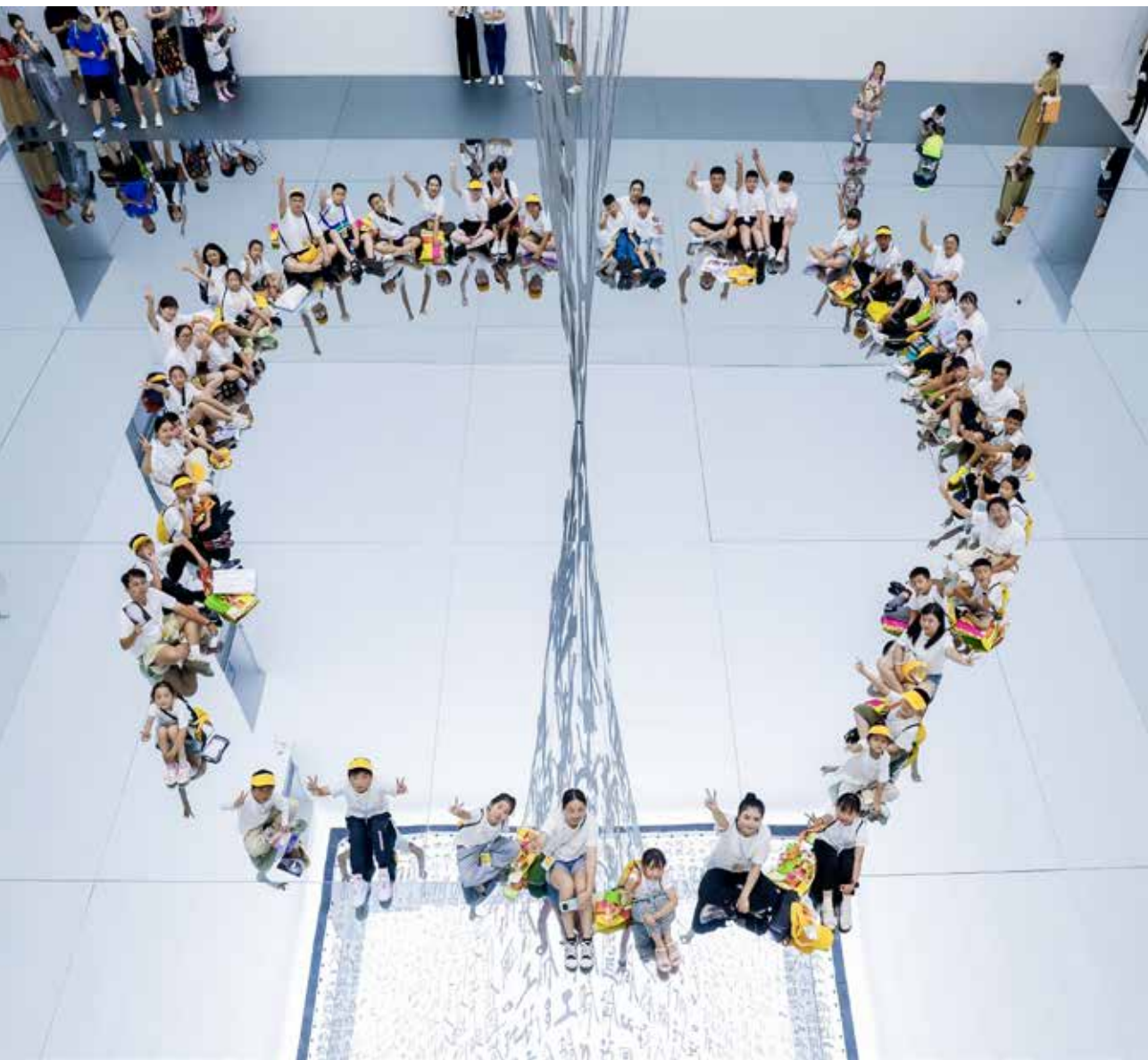
参营师生在艺术作品前合影