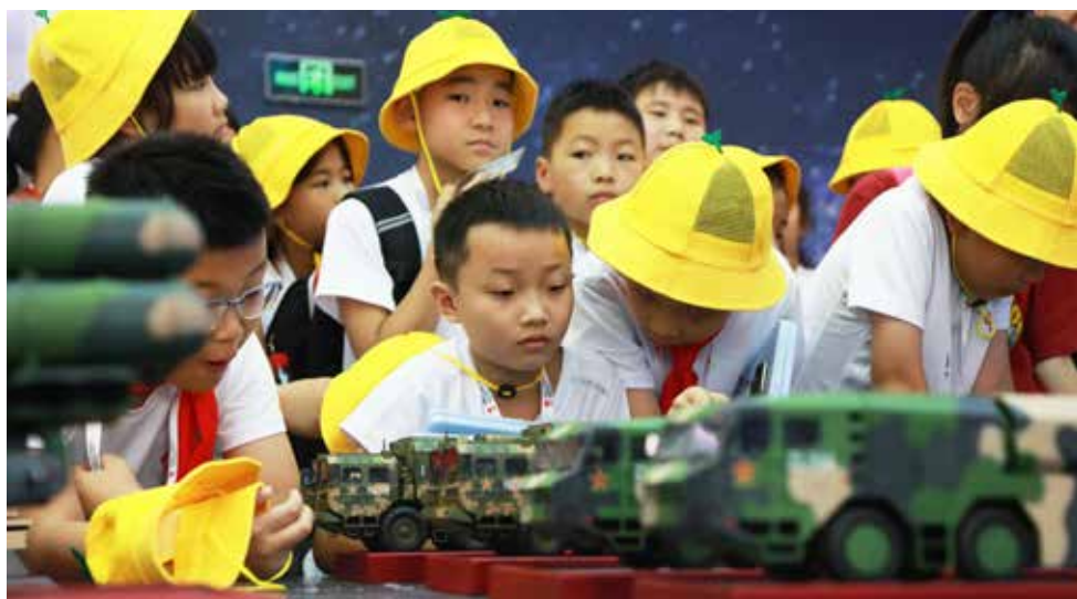
同学们到航小科航天科普馆、中国科学技术馆等参观，踏入科学殿堂，近距离感受科技的魅力