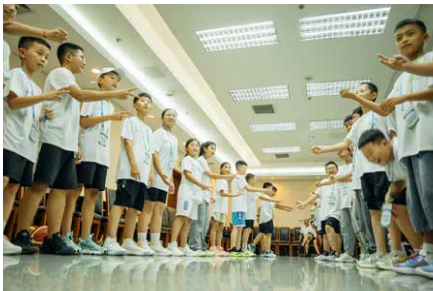
开营仪式上，孩子们参加破冰活动