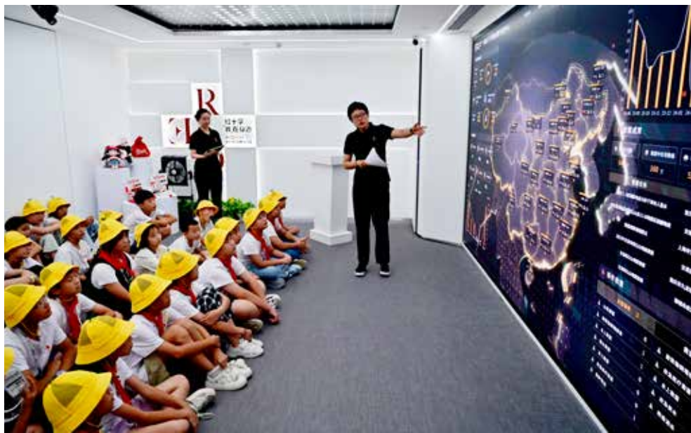
同学们来到中国红十字基金会数字资源中心参观