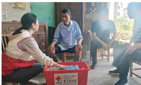
前方工作组在入户湖南汨罗市长乐镇受灾家庭时带去了赈济家庭箱