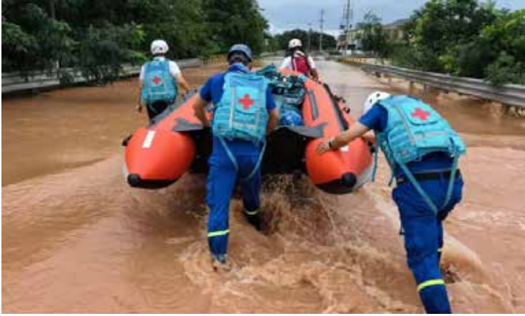
7月1日下午，湖南省红十字蓝天救援队、岳阳市红十字救援队在现场救援

8月1日，针对湖南省严重洪涝灾害，中国红十字会总会启动三级应急响应。根据总会工作部署，中国红十字基金会加入总会工作组，赴郴州一线。