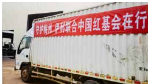
6月22日，伊利联合中国红十字基金会向梅州平远县捐赠营养物资