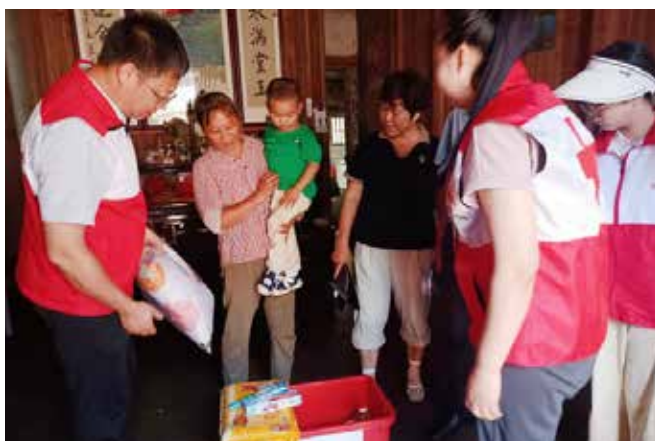
当地红十字会工作人员将赈济家庭箱送到黄山市休宁县受灾群众家中