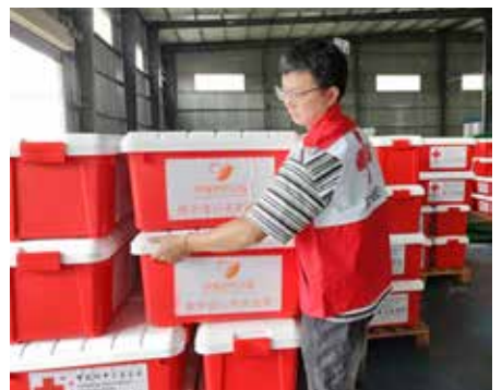
6月25日，中国红十字基金会向广西桂林捐赠 1000 只赈济家庭箱

根据中国红十字会总会防汛救灾工作组在桂林实地调研的情况和桂林市红十字会的申请，中国红十字基金会携手北京字节跳动公益基金会援助 20 万元，支持桂林市开展防疫消杀工作并为 934 户受灾家庭提供米、油、夏凉被等生活物资，保障受灾群众生命健康安全和生活需求。