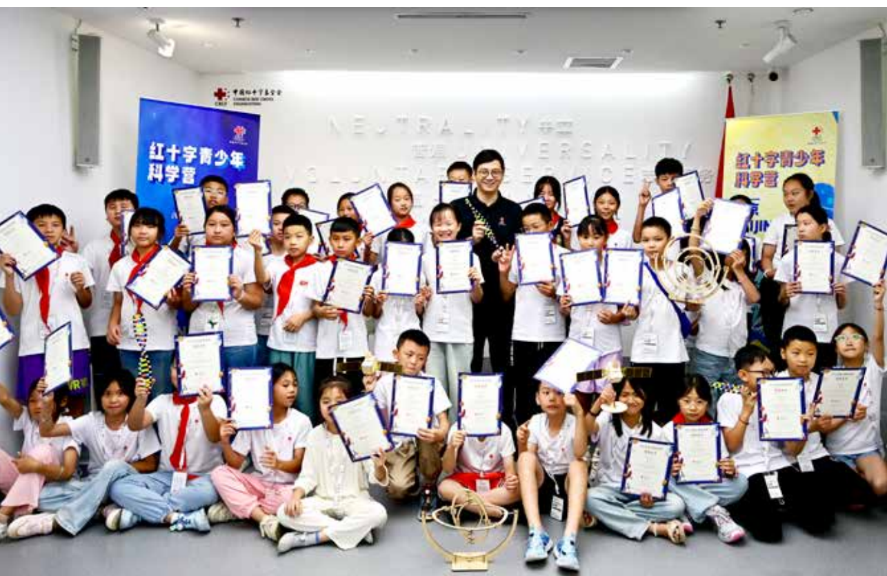
中国红十字基金会理事长贝晓超出席闭营仪式，并勉励同学们以此为起点，在未来的科学探索旅程中继续保持好奇心、勇于创新