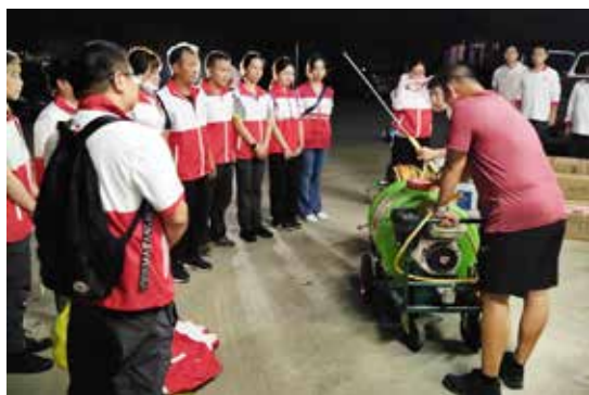
红十字消杀志愿服务队接受统一培训

9月4日以来，台风“摩羯”对广西等地造成严重灾害。根据受灾地区实际需求，中国红十字基金会向广西壮族自治区红十字会提供100万元赈济救助金。本次捐赠将为钦州市受灾家庭灾后勤置生活必需品、恢复正常生产生活提供支持。该笔救助金包含支付宝公益平台爱心网友捐赠。