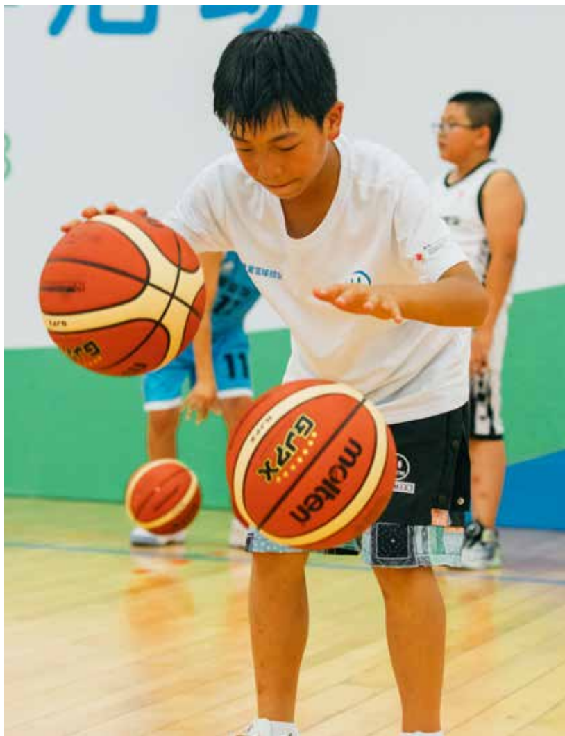
在北京国家奥林匹克体育中心，孩子们接受专业的篮球集训