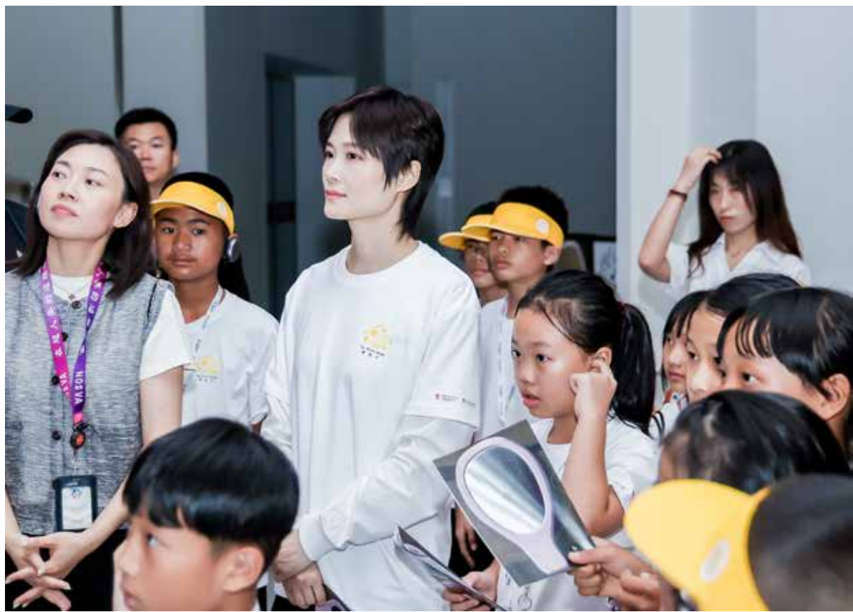
中国红十字会玉米爱心基金终身形象代言人、“黄房子”项目发起人李宇春与参加活动的师生参观展览，体验艺术手工