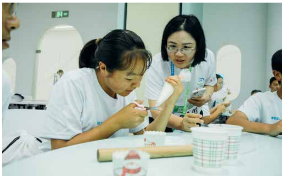
活动期间，孩子们先后前往北京天文馆、中国古动物馆、内蒙古伊利现代智慧健康谷等地参观体验