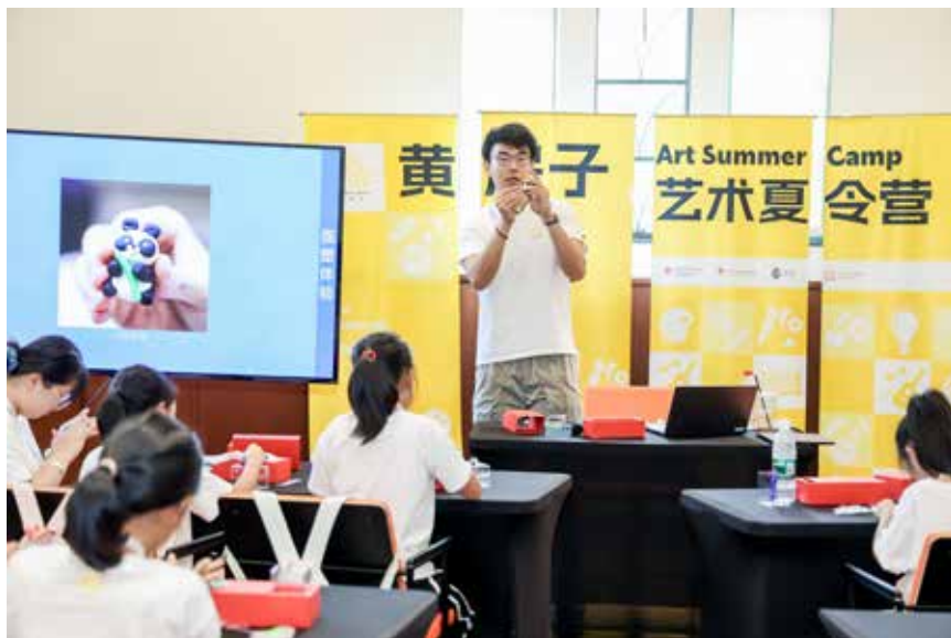
夏令营期间，同学们通过参观学习和创作，体验多种艺术形式