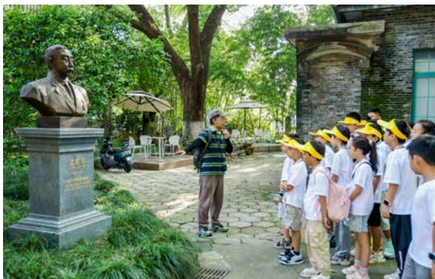
师生走进位于苏州大学的红十字国际学院，学习红十字历史和文化