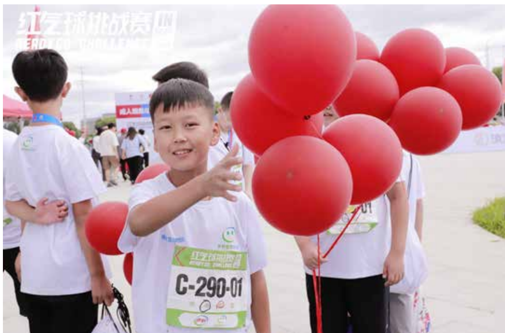
8月11日，孩子们来到内蒙古呼和浩特，参加“红气球挑战赛”，学习急救本领