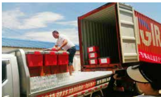
7月4日，中国红十字基金会支援湖南受灾地区的第二批800只赈济家庭箱运抵汨罗市

7月7日，东润公益基金会携手中国红十字基金会，向湖南岳阳受灾地区捐赠1114只赈济家庭箱，保障受灾家庭基本生活所需。该批赈济家庭箱7月7日晚起陆续送达湖南岳阳。这是中国红十字基金会携手社会爱心力量向湖南洪涝灾区捐赠的第四批赈济家庭箱。