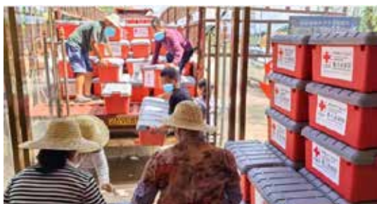
6月26日，中国红十字基金会向广东捐赠2000只赈济家庭箱

6月22日，伊利联合中国红十字基金会捐赠17160盒伊利舒化奶等营养物资，驰援梅州市平远县。在伊心向阳志愿者团队的努力下，这批物资于当日运抵平远县泗水镇，为当地受灾群众提供爱心和营养支持。