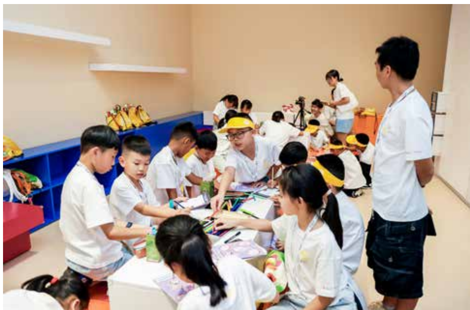
在浦东美术馆艺术老师的指导下，同学们体验“美普绘·超现实主义手工坊”