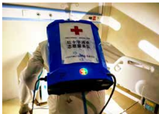
红十字消杀志愿服务队在桂林市人民医院开展消杀工作