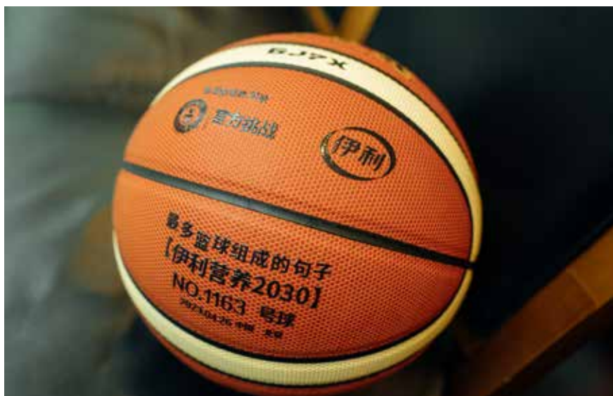
成功挑战吉尼斯世界纪录的篮球