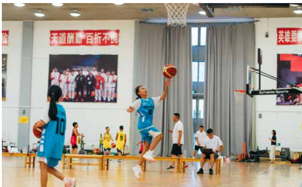
在北京国家奥林匹克体育中心，孩子们接受专业的篮球集训