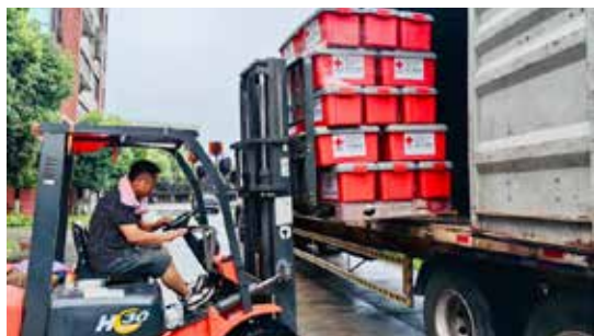
7月5日，中国红十字基金会向湖南省追加支持2000只赈济家庭箱