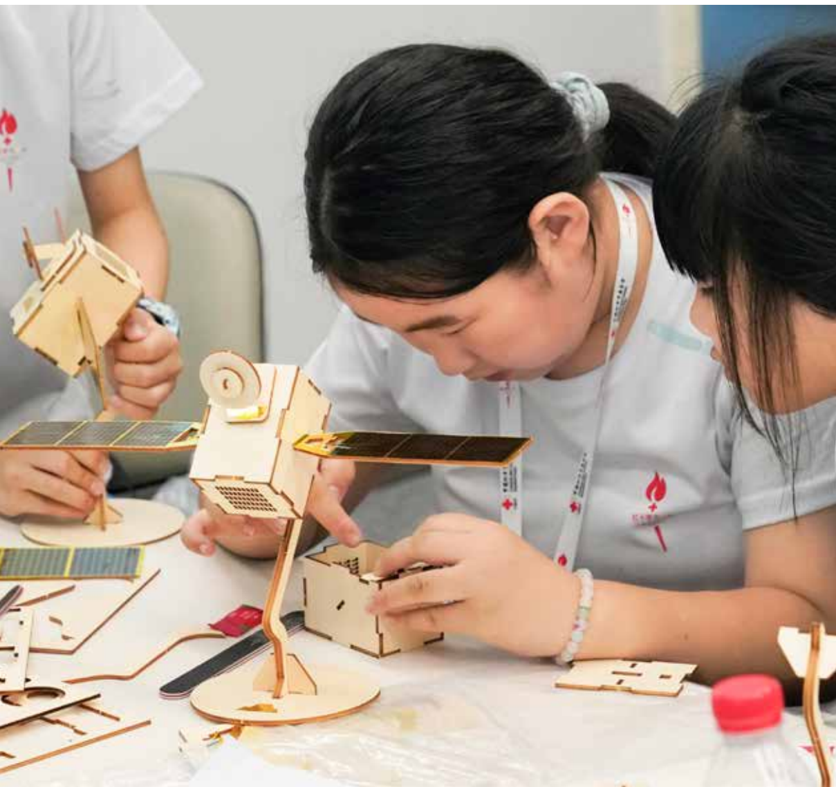
活动中，同学们围绕“火箭技术原理”、“卫星应用技术”、“载人航天”等航天主题展开项目式学习，通过操作实验，设计解决方案，将课堂知识转化为实践成果