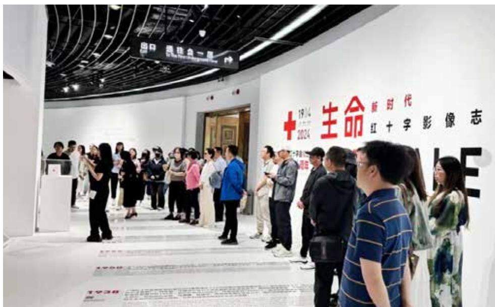
来自社会各界的参观者