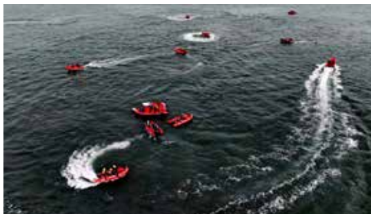
社会救援力量参加水域救援训练