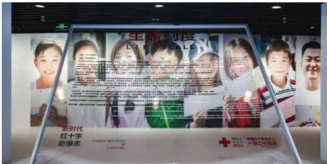
《生命刻度：新时代红十字运动影像志》摄影展