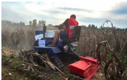
2023年8月，中国红十字基金会“以工代赈”项目在河北省保定市启动