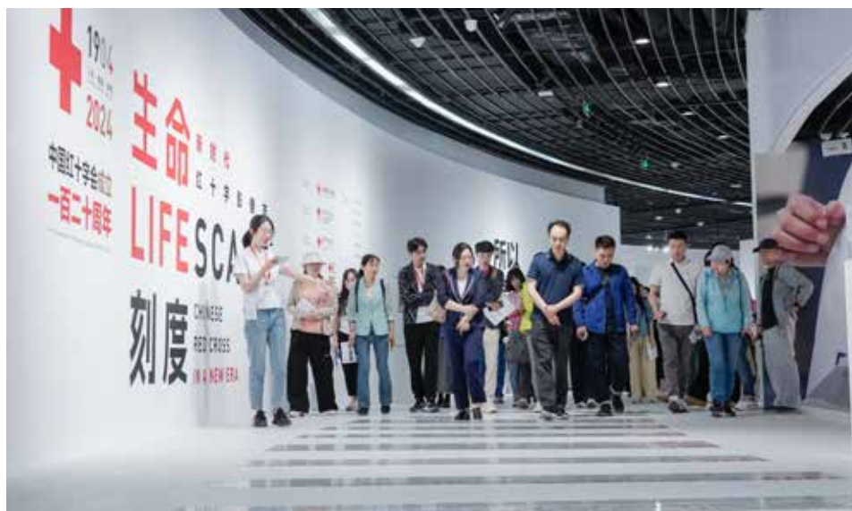
参观者走过“人道与共”展区时光长廊