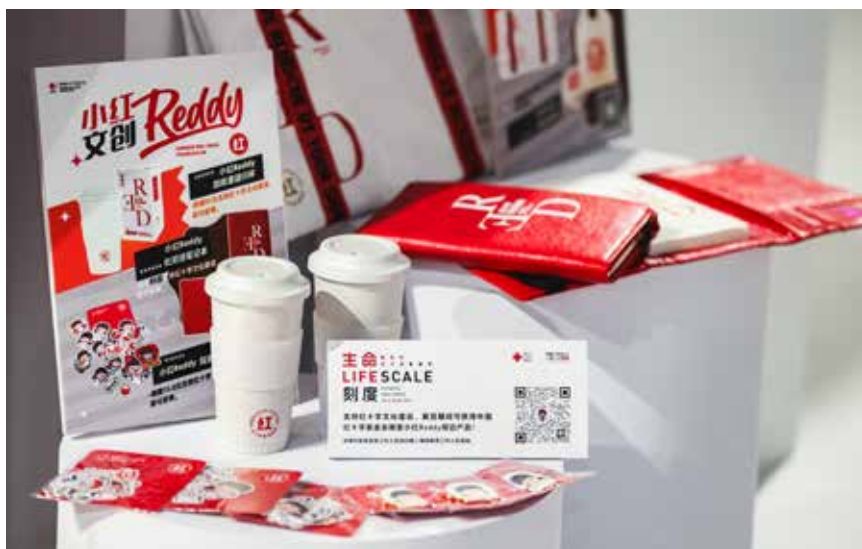
中国红十字基金会 IP 形象小红 REDDY 文创品进行展示和义卖，受到观展者热捧