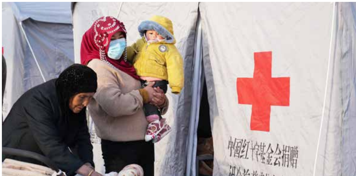
2023年12月19日、20日，位于甘肃省积石山县大河家镇克新民村，青海省民和县中川乡金田村、清二村、官亭镇官东村等地的红十字安置点陆续搭建启用

实施“罕见病关爱行动”“地贫救助行动”“生命接力基金”“爱眼护眼工程”和“关爱乡村少年眼健康项目”，为全国34万人完成视力筛查。立项援建博爱卫生站、博爱校医室、“健康e站”、英雄能量站、博爱学校、未来教室等共280余所，培训乡村医生、儿科医生、校医、基层医生超过3.1万名。