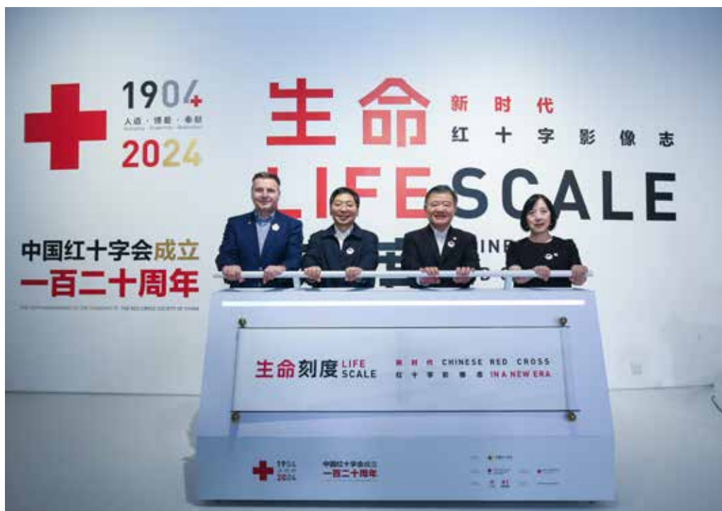
5月10日,中国红十字会领导与红十字国际组织东亚地区代表共同为摄影展揭幕

国家医疗保障局、国家卫生健康委、联合国世界粮食计划署、联合国儿童基金会驻华代表处等代表参加开幕式。