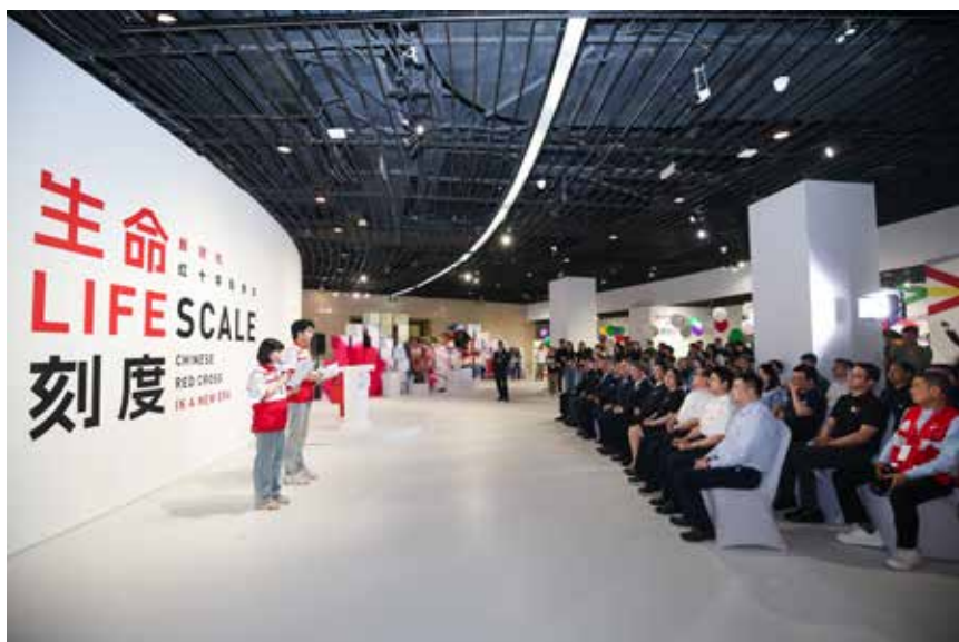
《生命刻度：新时代红十字影像志》摄影展开幕式