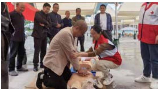
在四川省雅安市汉源县九襄镇龙池村博爱家园项目点，汉源县红十字会为村民开展急救培训

干培训项目，计划用3年时间，对全国约1500支社会应急救援队伍的骨干成员进行分场景、分类别、分层次的专业培训，提升社会应急救援队伍的灾害应急反应和协同救援能力，助力健全专业高效、运转协调的红十字应急救援机制。截至2023年底，已累计培训来自27个省份的500余名社会应急救援队伍骨干成员，期间，近百名学员与其所在救援队伍投身救援一线。