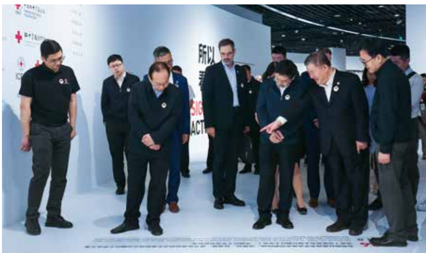
领导嘉宾参观“人道与共”展区时光长廊，一条条大事记像生命的年轮，记载着中国红十字会 120 年筚路蓝缕、铿锵行进的辉煌历程