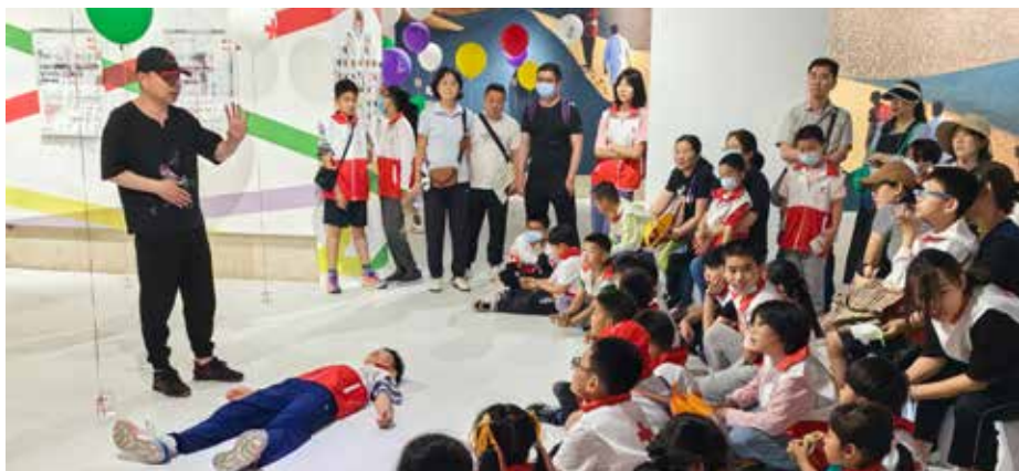
参观团体在现场开展应急救护培训