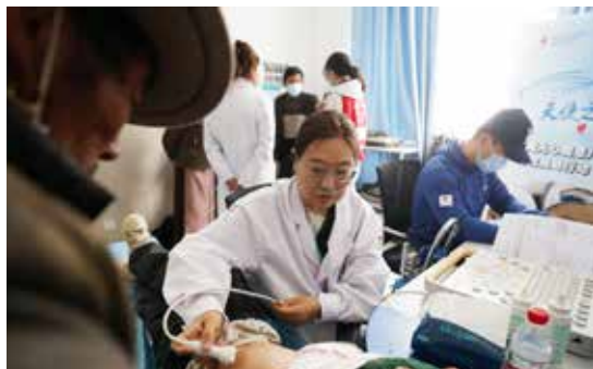
2023年8月，中国红十字基金会“天使之旅——先心病患儿筛查救助行动”走进西藏