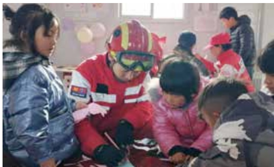
参训后的红十字救援队队员在积石山地震儿童活动点开展儿童关爱活动