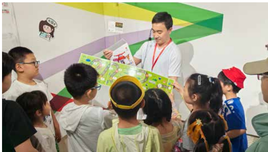
中国红十字基金会工作人员给前来观展的小朋友们展示“英雄能量包”