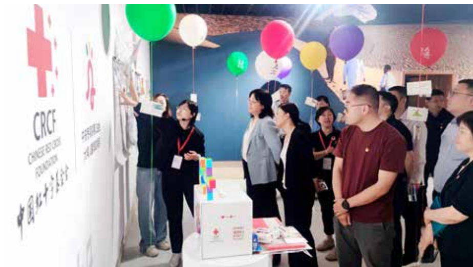
中国红十字基金会工作人员向观众介绍“中央专项彩票公益金大病儿童救助项目”