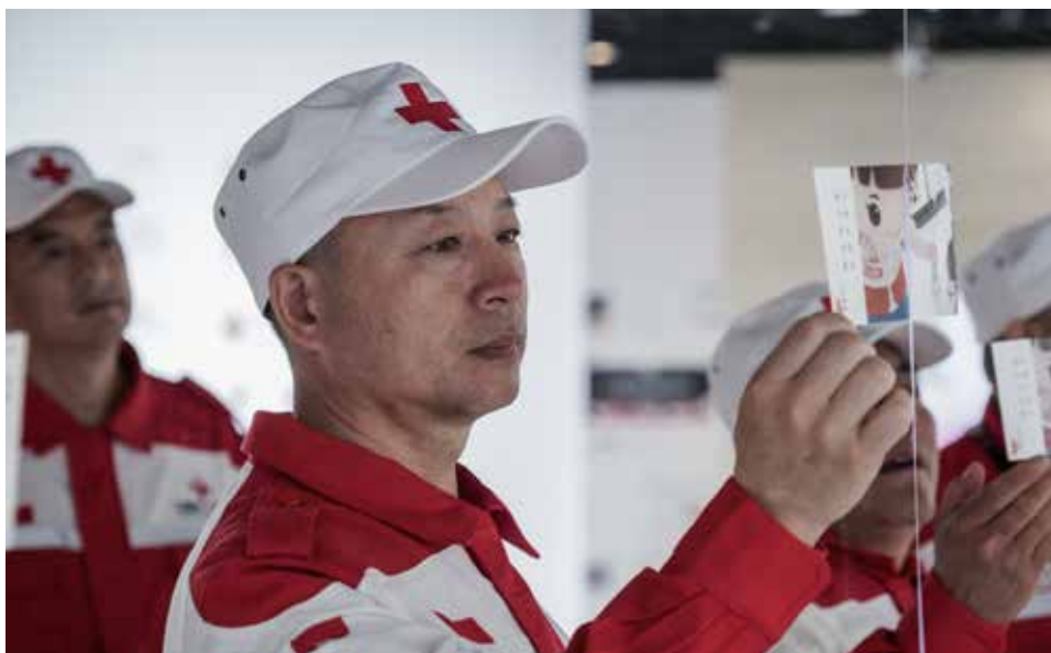
参观者阅读“中央专项彩票公益金大病儿童救助项目”受助患儿的回信