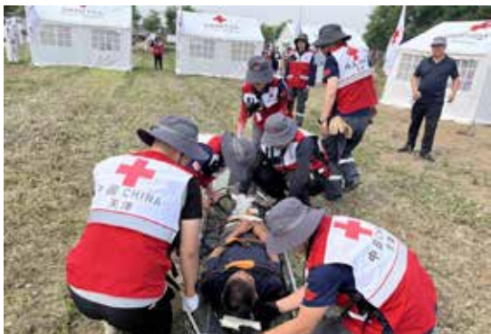
在天津市武清区博爱家园项目点，天津市红十字会开展灾害应急实战演练活动