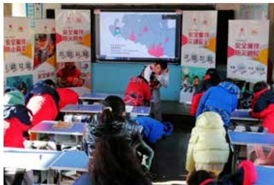
中国红十字基金会携手保定市红十字众和救援队为易县的小学生开展安全知识科普