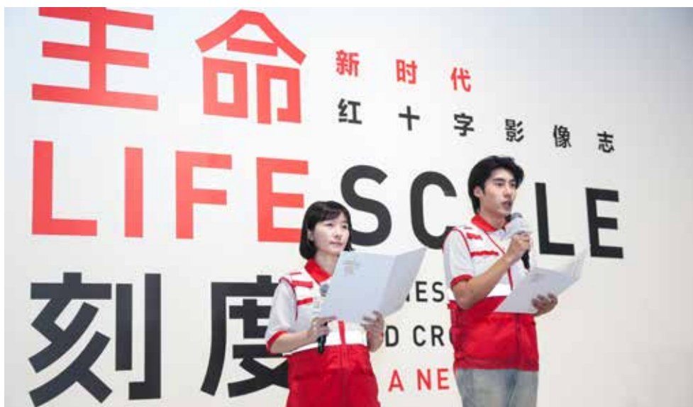
红十字会员、志愿者宣读《国际红十字和红新月运动七项基本原则》