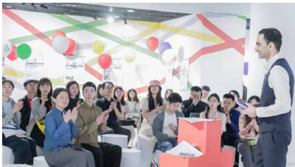
“国家红会与国际人道行动”专题讲座