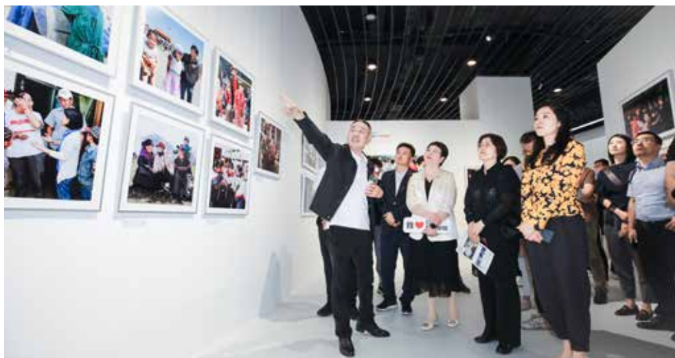
红十字国际学院部分在京校友集体观展