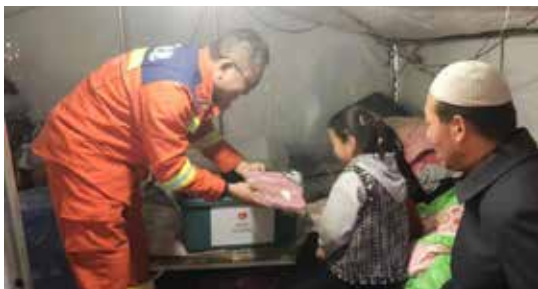
2023年12月18日，甘肃积石山地震发生后，红十字救援队将赈济家庭箱送至安置点的受灾家庭

在中国红十字会总会指导下，中国红十字基金会联合红十字国际学院、在上汽通用五菱汽车股份有限公司支持下于2023年起开展社会应急力量骨