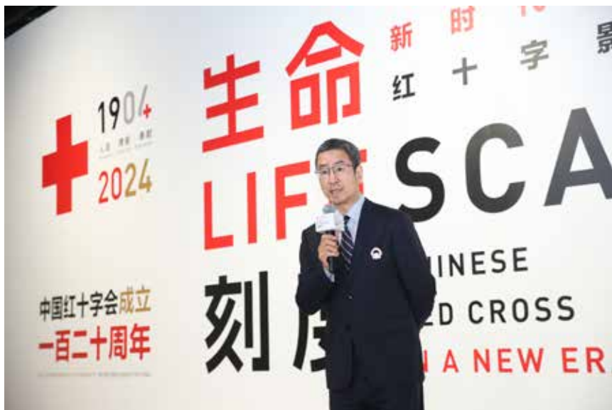
中国红十字会副会长白岩松主持开幕式